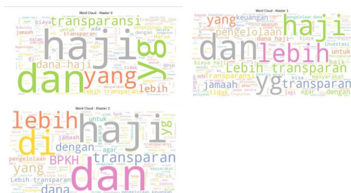
Gambar 2. World Cloud per Klaster

Untuk memperkaya pemahaman terhadap persepsi masyarakat, dilakukan analisis kualitatif terhadap tanggapan terbuka dari responden mengenai saran perbaikan pengelolaan keuangan haji oleh BPKH. Pendekatan ini digunakan untuk menangkap nuansa persepsi yang tidak tercermin dalam data kuantitatif, sebagaimana disarankan oleh Flick (2018) dalam pendekatan metode campuran dalam studi sosial.